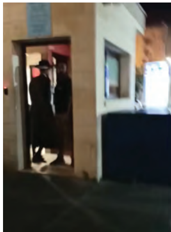
נישט ווייניג האט דער ירושלימ'ער צורה פון הרב שישא - מיט'ן מאסק כמובן - געדארפט אריינגלייפן אין פאליצייאישע טורמע-סטאנציע אין די לעצטע תקופה

משנתו: אויב מיר מעגן אריינהאקן מיט א זייטיגע פראגע, ווי מיר פארשטייען זענען אנקלאגעס געווען בלויז פארן נישט אויספאלגן די געזונטהייט רעגולאציעס, דאס הייסט אז פארן עצם פראטעסטירן אן קיין פערמיטן ווערט מען נישט